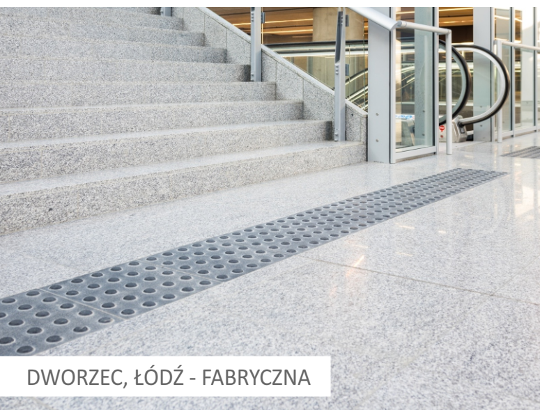
DWORZEC, ŁÓDŹ - FABRYCZNA