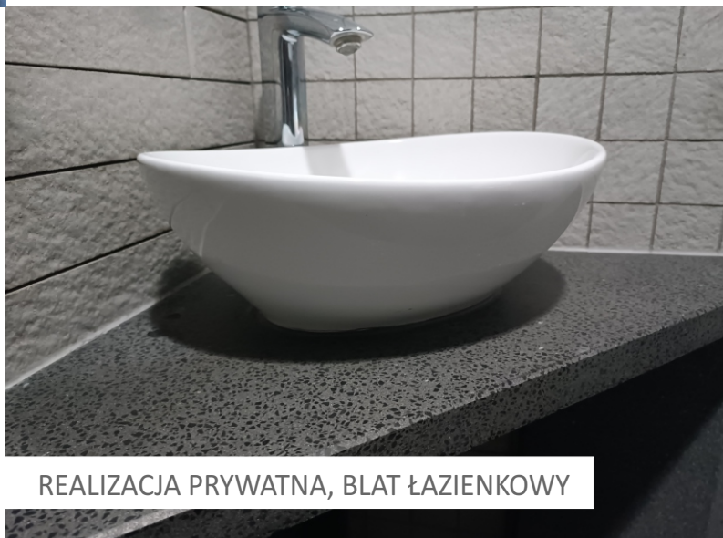
REALIZACJA PRYWATNA, BLAT ŁAZIENKOWY

Lastrykowe blaty łazienkowe, które swoim wzornictwem dopasują się do projektu realizowanego w praktycznie każdym stylu architektonicznym, stanowią interesujące, praktyczne i niezwykle trwałe rozwiązanie. Lastryko jest odporne na uszkodzenia mechaniczne, zarysowania, plamy, a także radzi sobie doskonale z codzienną eksploatacją , taką jak wilgoć, zabrudzenia oraz ekspozycję na intensywne użytkowanie. Blaty łazienkowe projektowane są indywidualnie.