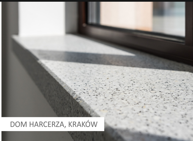
DOM HARCERZA, KRAKÓW

Parapety i progi drzwiowe wykonane z betonu szlachetnego to estetyczne oraz trwałe rozwiązanie dla wnętrz. Odporność na uszkodzenia i intensywne użytkowanie sprawiają, że wyroby doskonale sprawdzają się w miejscach wzmożonej eksploatacji. Elementy są dostępne w różnorodnych formatach i wzorach , mogą stworzyć harmonijną całość, dopasowując się do każdego projektu. Zarówno progi jak i parapety mogą być dowolnie konfigurowane pod względem szczególnego użytkowania .