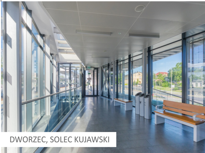
DWORZEC, SOLEC KUJAWSKI

Betonowe donice, pojemniki na odpady, postumenty, ławki i inne elementy wykonane z betonu architektonicznego lub lastryka to doskonałe połączenie trwałości, funkcjonalności oraz estetyki, oferujące nieograniczone możliwości aranżacyjne. Na etapie projektowania istnieje dowolność wyboru kształtu, funkcjonalności, wzoru a także rodzaju wykończenia elementów . Wyroby mogą stanowić zarówno użyteczny jak i niepowtarzalny akcent projektowanej przestrzeni.